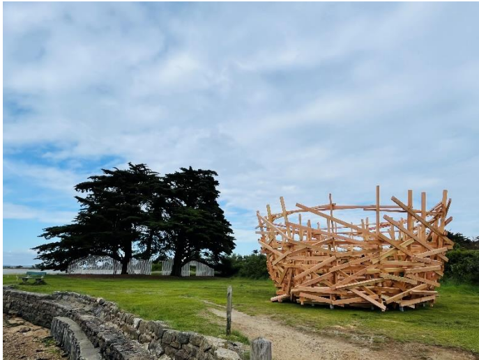
Exposition « Nids et Cabanes » de Tadashi Kawamata. Berno. Ile d'Arz.