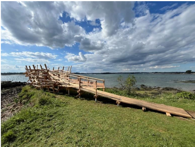
Exposition « Nids et Cabanes » de Tadashi Kawamata. Brouel Ile d'Arz