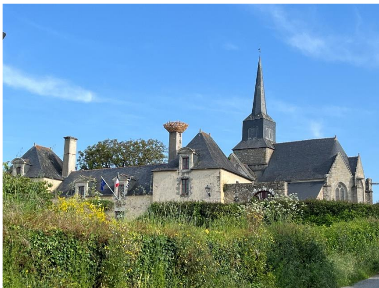
Exposition « Nids et Cabanes » de Tadashi Kawamata. Le Prieuré. Île d'Arz.

Pour celles et ceux qui n'ont pas encore pu les découvrir, voici un aperçu des œuvres disséminées sur l'île.