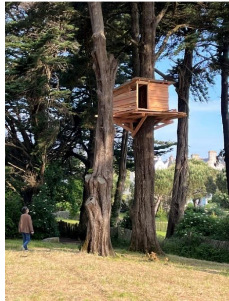
Exposition « Nids et Cabanes » de Tadashi Kawamata. Penera. Ile d'Arz.