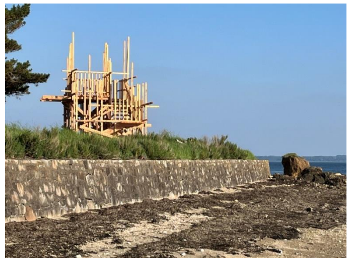
Exposition « Nids et Cabanes » de Tadashi Kawamata. Bilhervé Ile d'Arz