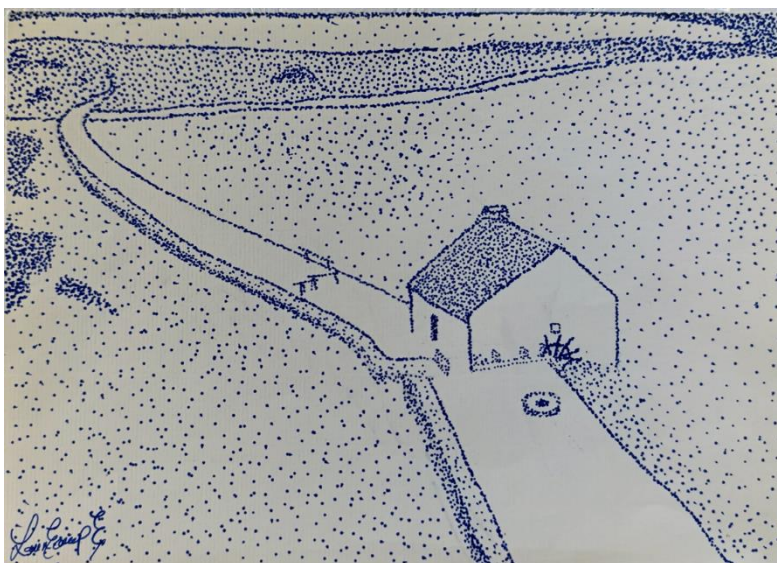
Dessin de Louise Camp, lauréate catégorie « Grands »

Rachel effectue les visites guidées du moulin ou de l'exposition jusqu'à la fin des vacances scolaires de la Toussaint. N'hésitez pas à la contacter pour en profiter !