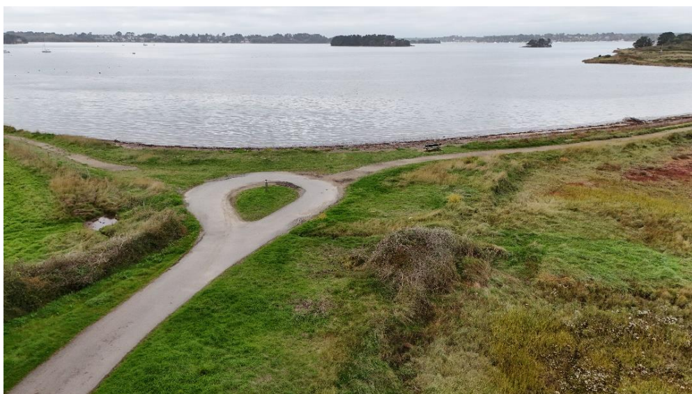
Avec l'enlèvement des épaves, à Berno la nature a repris ses droits (ou presque !).