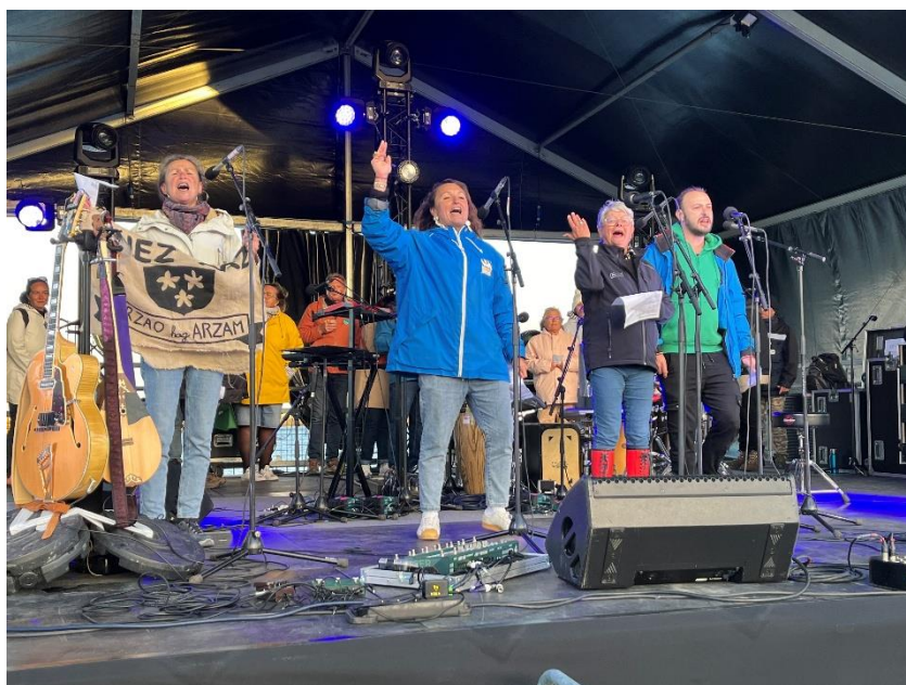
A Sein, ce quatuor ildarais a su se faire entendre !

Nous nous en rappellerons de cette 11ème édition des Insulaires. Comme à son habitude l'Ile de Sein a été rythmé par la météo et ses traversées de la mer d'Iroise. L'occasion de tester joyeusement les pieds marins des insulaires (des 15 îles) du Ponant. Heureusement le dieu du festival était lui aussi au rendez-vous, laissant de belles fenêtres aux accalmies et aux festivités. Joie de se retrouver, accueil chaleureux des sénans, manifestations culturelles, défis sportifs, échanges-débats, patrimoine-nature... Une rencontre réussie, bravo aux sénans pour cette belle fête ! Promis l'an prochain, nous tâcherons de relever à notre tour le défi avec autant d'enthousiasme sur l'Ile d'Arz !